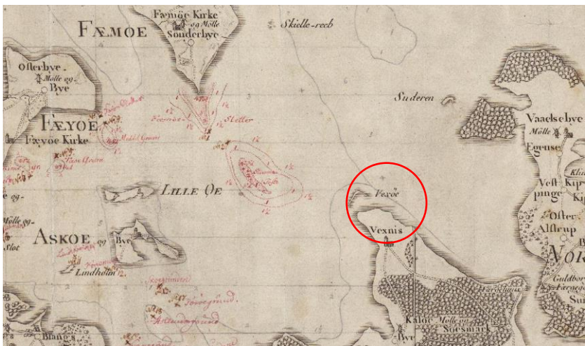
Smålandshavet ved Guldborgsund med Wixnes og Vexöe.

Dronning Sophies enkestand kom til at strække sig over 43 år, og fra den største del af dette lange tidsrum, er der i hendes arkiv blandt andre ting be-varet en række kopibøger, som vedrø-rer styrelsen af Livgedinget. Det er fra disse kopibøger følgende eksempler er hentet.